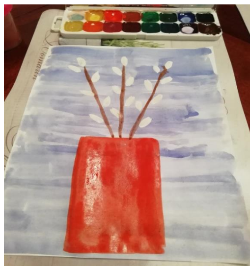
5. Итог работы.