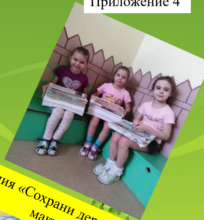
Акция «Сохрани дерево и собери макулатуру»