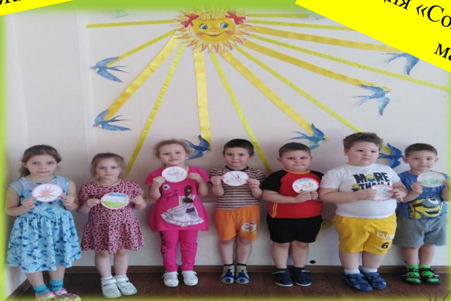
Эко – знаки: «Берегите лес от пожара!» «Не вырубайте леса!»