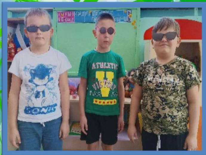
Эксперимент «Слепой крот»