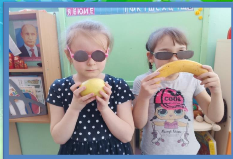
«Узнай по запаху»